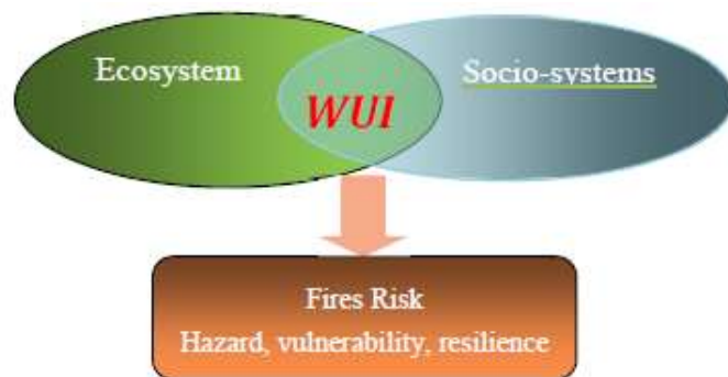
Fig 1. Fire risk emerging from the interaction between ecosystems and socio-systems